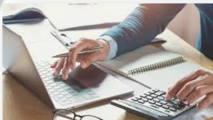
ACCONTO IRPEF, IRES, IRAP

ART.20 – Per gli acconti IRPEF, IRES e IRAP, dovuti per il periodo d'imposta successivo a quello in corso al 31 dicembre 2019, non si applicano sanzioni ed interessi per omesso o insufficiente versamento, se l'importo versato non è inferiore all'80% della somma che risulterebbe dovuta a titolo di acconto sulla base della dichiarazione relativa al periodo di imposta in corso.